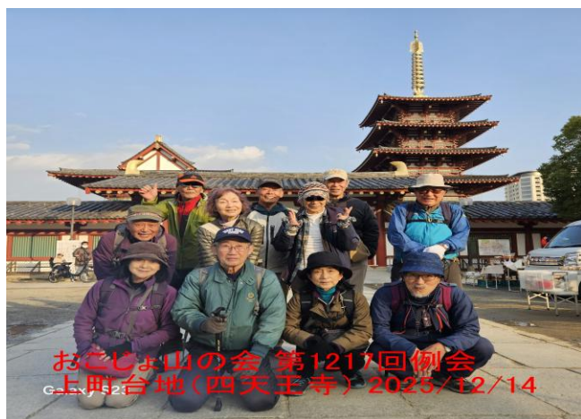
上町台地(四天王寺)