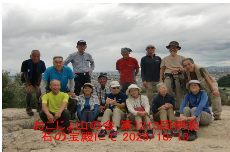
おこじょ山の会 第1213回例会 石の宝殿にて 2025/10/13