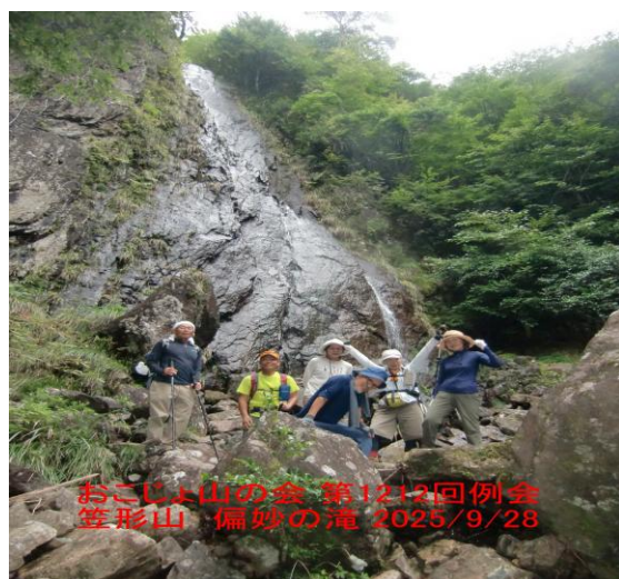
おこじょ山の会 第1213回例会 笠形山・偏妙の滝 2025/9/28