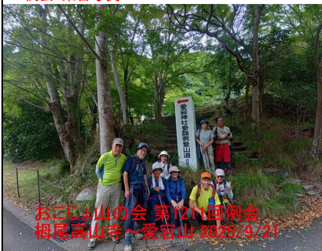
おこじょ山の会 第1211回例会 栂尾高山寺～愛宕山 2025/9/21