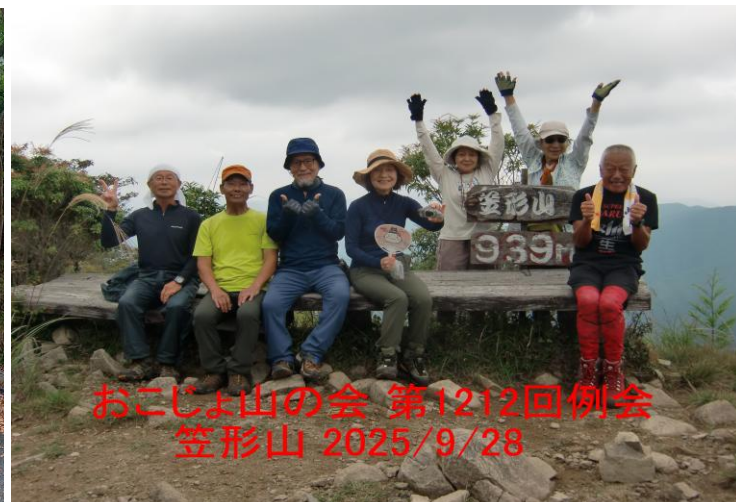
おこじょ山の会 第1212回例会 笠形山 2025/9/28